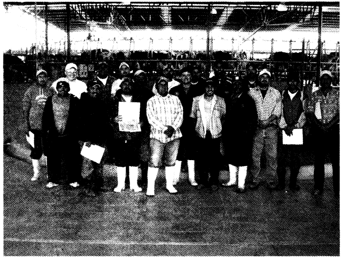
Entrega de certificados.

Es necesario tomar conciencia de las diferencias que existen entre las personas, no todo el personal muestra la misma capacidad laboral, disponibilidad al trabajo, compromiso, etc. El reconocimiento de estas diferencias puede ser de orden económico o de diversos beneficios laborales. La ausencia de diferenciación conduce a considerar que no vale la pena el esfuerzo ya que todo da igual, desestimula y en ocasiones origina riñas u enojos y un ambiente laboral de estancamiento y mediocridad. Se debe considerar los estímulos económicos con cierta precaución, en ocasiones el otorgamiento de dinero no genera los resultados esperados. Sin embargo, el reconocimiento honesto a la buena labor, la