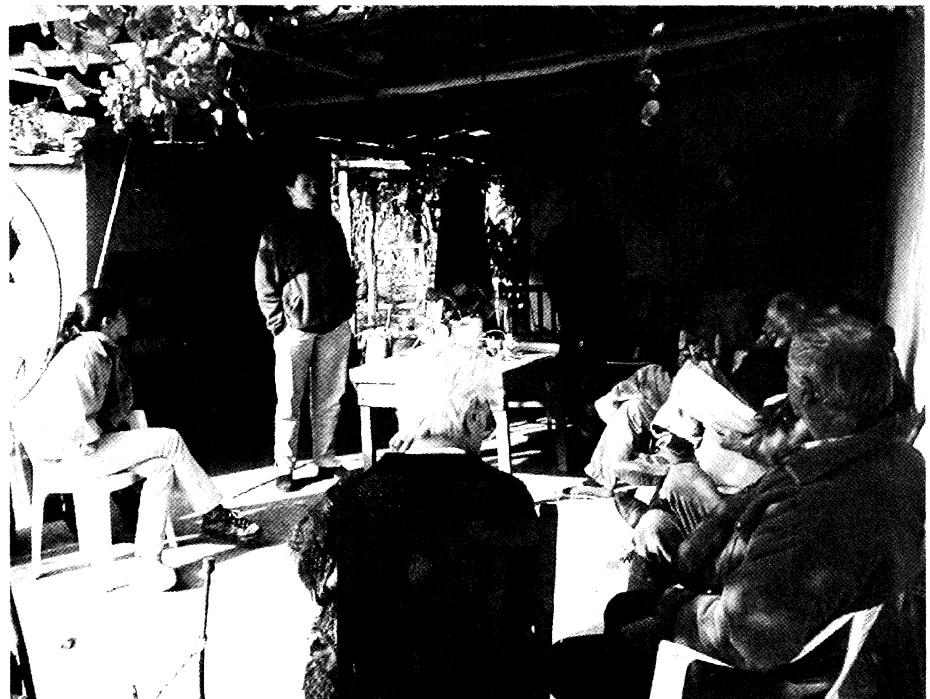
Reunión del Grupo Queseros con el equipo. Año 2006

difusionista, y se han usado en algunas instancias herramientas metodológicas de corte más analítico que holístico o sistémico. En el mismo sentido, se pudo "entrever" que coexisten a la interna del equipo que lleva adelante la intervención posturas que, si bien no son totalmente divergentes, tampoco son del todo convergentes.