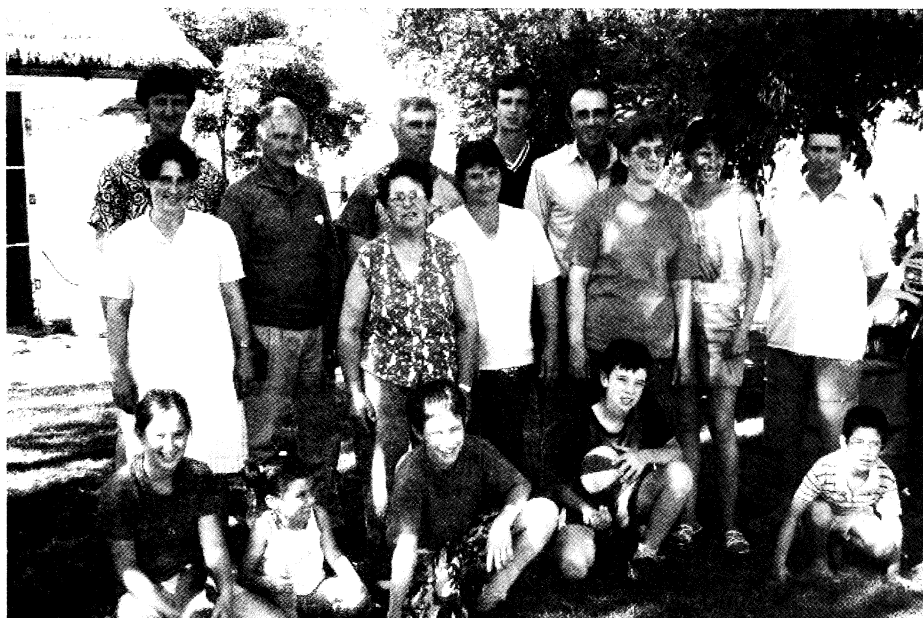
La familia quesera de la Zona Guichón.

A través de la observación de la actividad a campo se pudo constatar que ha existido una relación de horizontalidad y respeto entre los miembros del equipo técnico y los productores implicados, así como la puesta en práctica de la interdisciplina.