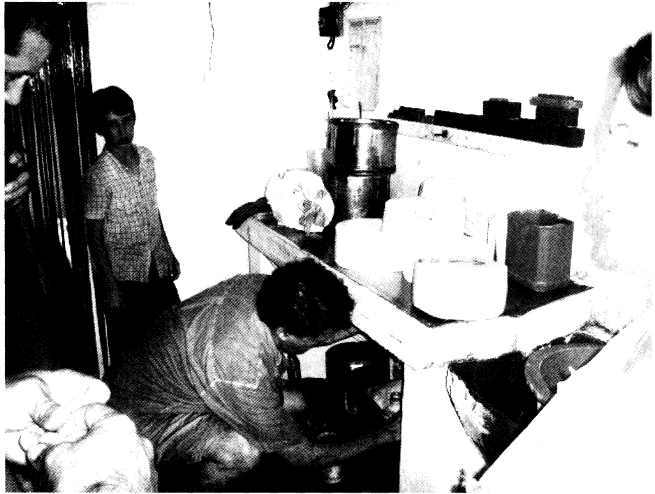
Actividades con el Proyecto 100 Queserías de LATU.

No obstante, en la intervención específica que se analizó (etapa 2004-2005 financiada por URural), se pudo apreciar que, junto con esta visión de carácter más general que sin duda está presente -se visualiza con claridad no sólo en la formulación teórica (proyecto escrito) sino también en su aplicación práctica, y se manifiesta en las entrevistas y en la observación directa de cómo se efectiviza en el campo la relación técnica- se usan y aplican también estrategias que se corresponden con otro tipo de marcos teóricos. Se podría decir que en algunos casos se han aplicado estrategias o instrumentos de tipo