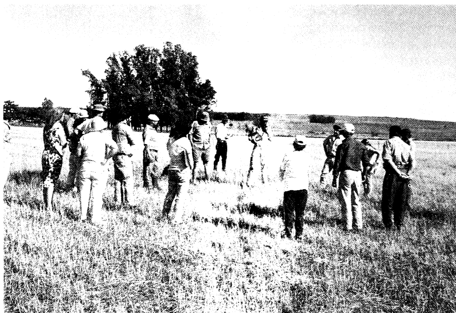
La recorrida del predio: la observación colectiva.

Es así que, basados en las metodologías desarrolladas entre 1997 y 1999 en la zona de Colonia 19 de Abril, se implementaron al comienzo del proyecto en Guichón charlas, jornadas de campo y ensayos demostrativos de forma de ir cumpliendo diferentes objetivos. Se realizaron actividades para nivelar el conocimiento de alguna problemática específica aportando soluciones generales, para demostrar a nivel práctico el manejo de algunas técnicas o para discutir situaciones productivas seleccionadas a nivel predial. Se evaluó entonces la necesidad de disminuir la dispersión de esfuerzos en actividades sin abordaje reflexivo, por lo que se buscó una