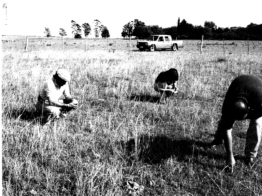
Analizando la problemática productiva.

En la región, la distinción entre tecnologías de insumos y de procesos procede de Viglizzo, quien define a las tecnologías de insumos como tangibles, de empleo relativamente sencillo y rutinario, asociadas a un desarrollo industrial previo y por ende con un costo económico. Por el contrario las tecnologías de procesos son intangibles, tienen incorporado un fuerte componente de información y conocimiento, su administración es compleja y relativamente creativa y el costo que poseen es de carácter intelectual. Mientras que las tecnologías basadas en insumos son de naturaleza coyuntural, las basadas en procesos son principalmente estructurales. Las tecnologías de insumos suelen ser propulsadas por empresas privadas que, mediante diversos instrumentos legales, las patentan y obtienen las correspondientes regalías. Por el