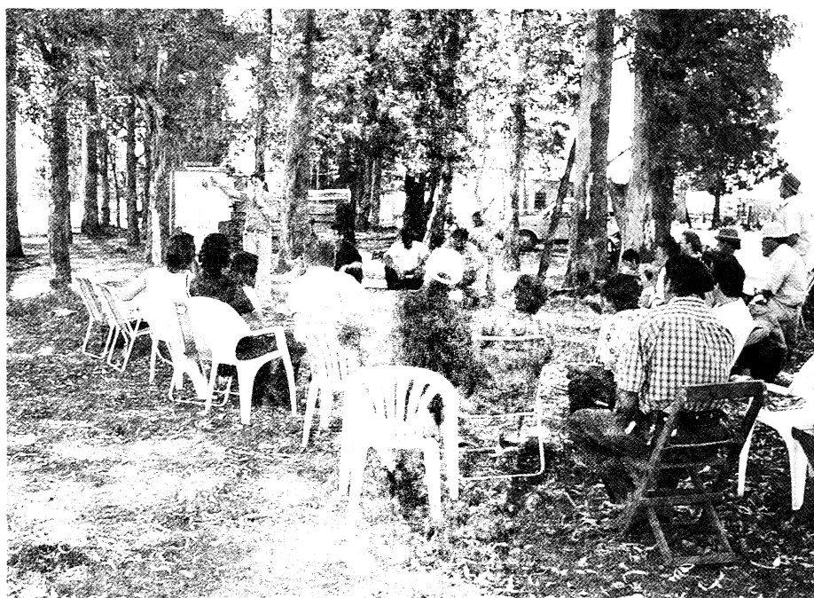
Los talleres: síntesis y reflexión sobre situaciones concretas.