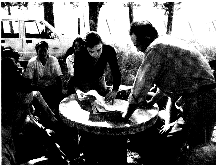
Firma de convenio con FOMYPES - 2006

Sumado a lo anterior, los proyectos iniciales recibieron diferentes financiaciones durante cuatro años de la Comisión Sectorial de Extensión y Actividades del Medio de la Udelar (CSEAM), finalizando a fines de 2004. En 2005 es el PUR quien comienza a financiar los técnicos de campo (Ing. Agrónomo y Trabajador Social). Una vez que surge esta fuente de financiación surgen también condicionamientos que conspiran contra la forma integral y territorial de trabajar del PIE. Un ejemplo es que la asistencia técnica y los proyectos pasan a tener un perfil