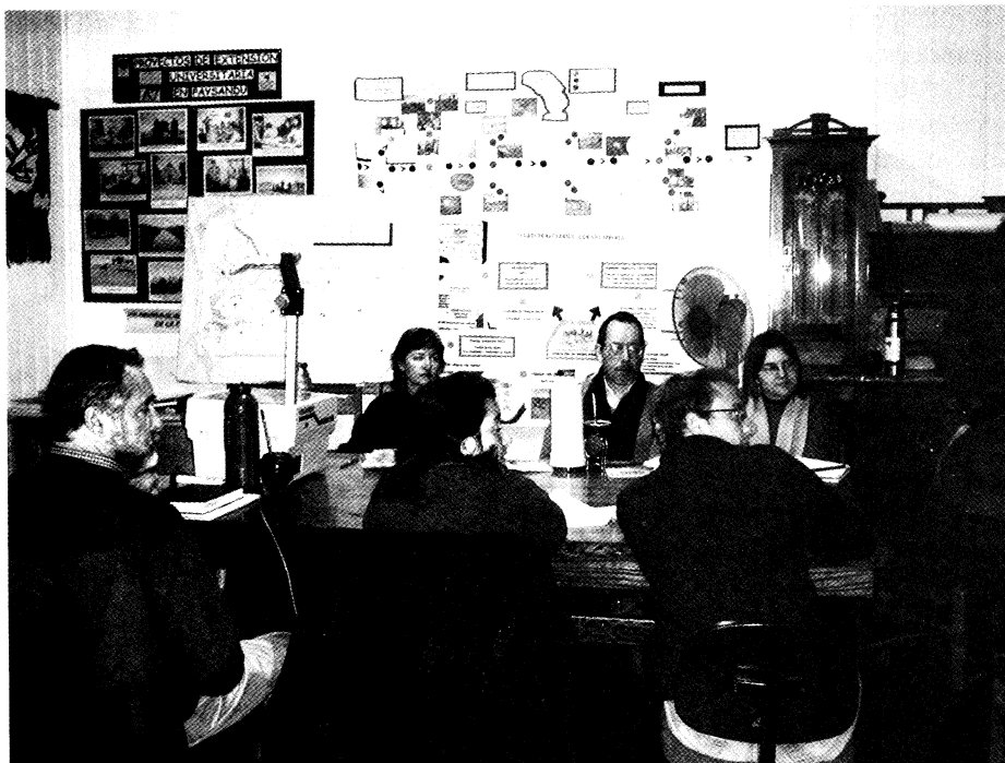
Reunión del equipo técnico con CSEAM y PUR

La convocatoria del conjunto de los integrantes de las familias de productores a las actividades del PIE en la ZG estuvo facilitada desde el comienzo por la integración de mujeres en los equipos de intervención y el carácter multidisciplinario de los mismos. En este sentido, durante todo el período el equipo docente mantuvo una marcada presencia femenina y una integración de técnicos del área agraria y del área social (Veterinarios, Ingenieros Agrónomos y Licenciadas en Trabajo Social). En el primer período de intervención el equipo docente estuvo integrado por docentes de las Facultades de Agronomía y Veterinaria, contratándose a través de proyectos las