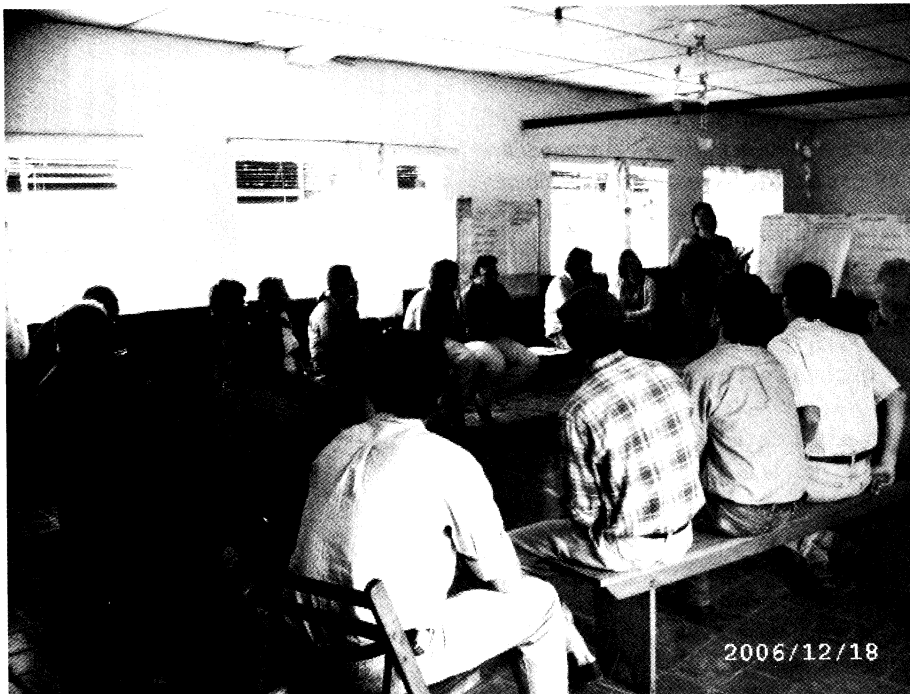
Capacitación a jóvenes en Guichón - 2006

La experiencia ha generado una importante acumulación de conocimientos pertinentes a la función universitaria que permiten generar discusión científica en relación a las metodologías de intervención en extensión rural, ligadas a la producción familiar y al desarrollo rural; incorporar nuevos contenidos a nivel de la actividad docente universitaria; y dar lugar a experiencias similares en otras zonas, implementadas por otro tipo de institucio-