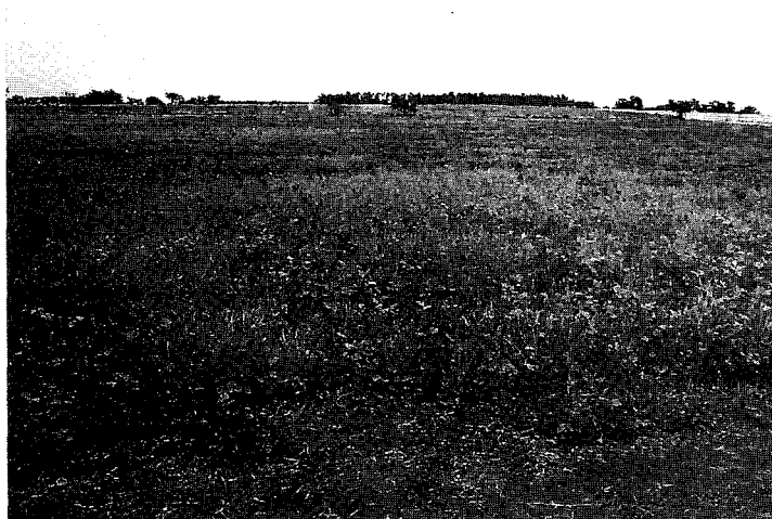
Figura 5 - Rastrojo a la salida del pastoreo con entrada en estado avanzado del cultivo («pasado»).

información preliminar proveniente del uso de sólo dos carneros Poll Dorset, se corroboran las expectativas generadas con el uso de esta raza en sistemas de cruzamiento terminal. A las buenas cualidades de crecimiento ya expuestas, debe agregarse el desempeño al parto manifestado por las ovejas que se inseminaron con carneros de esta raza. En el Cuadro 3 se presenta esta información y se observa que prácticamente no se registraron dificultades al parto, presentándose una incidencia de partos distócicos similar a la encontrada en las ovejas que