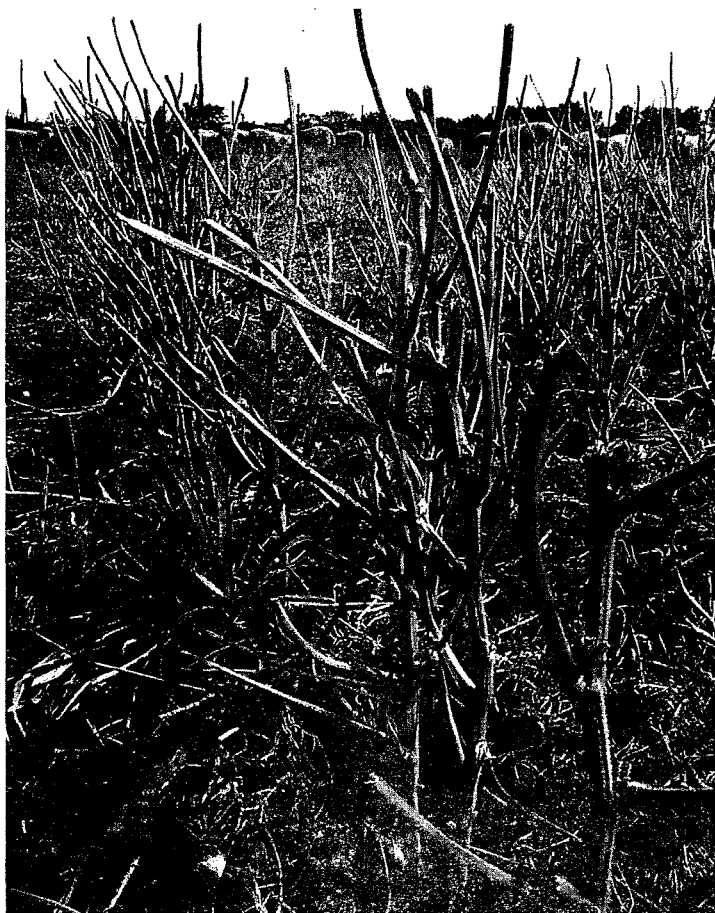
Figura 7 - Detalle del rastrojo a la salida del pastoreo.

habían sido inseminadas con semen de carneros Corriedale o Southdown.