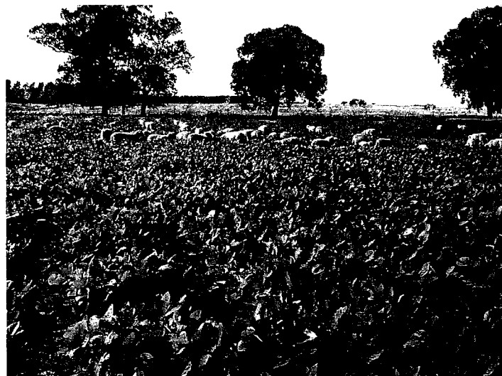
Figura 4 - Séptima franja: 63 días pos-siembra. Estado del cultivo: R3. Disponibilidad: 3.349 kg MS/ha. Relación hoja:tallo = 0,89.

Es una alternativa tecnológica coyuntural que agrega valor al producto, permitiendo la terminación (Cuadro 1) y venta de corderos en situaciones de escasez de forraje en cantidad y calidad como las que se registraron en el verano particularmente crítico en que se desarrolló el experimento (diciembre 2003/febrero 2004). A la valorización de kilos flacos generados en el período primaveral de bonanza forrajera, se agregan producciones de carne por unidad de superficie por demás significativas (Cuadro 2).