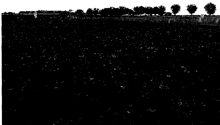
Figura 3 - Tercera franja: 53 días pos-siembra. Estado del cultivo: R2. Disponibilidad: 1.809 kg MS/ha. Relación hoja:tallo = 1,24.