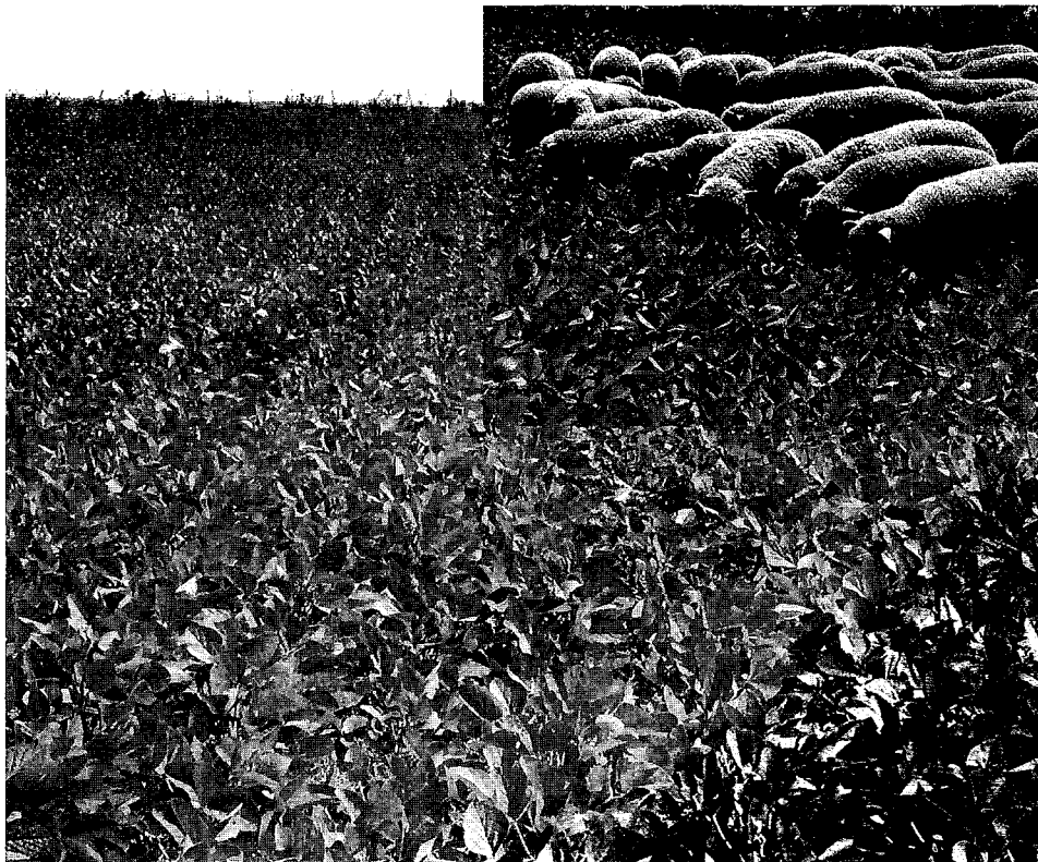
Figura 1 - Primera franja: 47 días pos-siembra.

Estado del cultivo: R1. Disponibilidad: 1.076 kg MS/ha. Relación hoja:tallo = 1,70.