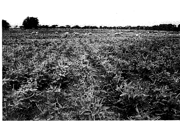
Figura 6 - Rebrote primera franja: 75 días pos-siembra. Disponibilidad: 1.157 kg MS/ha. Relación hoja:tallo = 0,81.