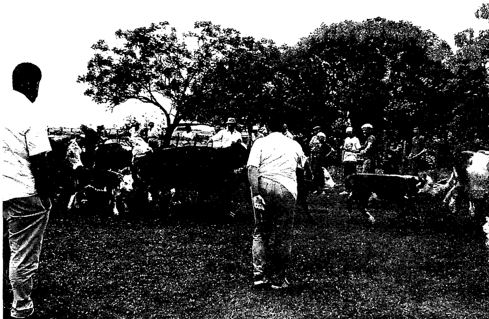
Jornada de manejo de rodeos de cría y control de reproductores (Establecimiento de la familia Bracesco, Colonia Juan Gutiérrez, 18/11/03).

Se requiere pasar a una etapa de avance en la discusión y se ha propuesto dar continuidad al seguimiento de algunas situaciones productivas. Para ello se ha comenzado a trabajar en un predio de Colonia «Juan Gutiérrez» (familia Jardim) bajo una modalidad de seguimiento de las prácticas de manejo animal y de pasturas, a través de visitas mensuales que permitan realizar registros así como acompañar al productor en la toma de decisiones. En una frecuencia bimensual, se propone a su vez abrir el establecimiento para jornadas de análisis y discusión con el resto de los vecinos. ■