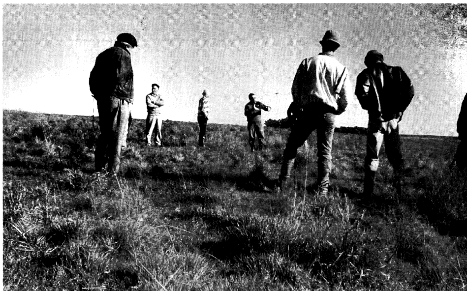
Jornada sobre campo natural (establecimiento de la familia Jardim, Colonia «Juan Gutiérrez», 24/5/02).

1) el estado actual de la pastura es el resultado de decisiones anteriores (" el pasto de primavera se hace en otoño e invier-