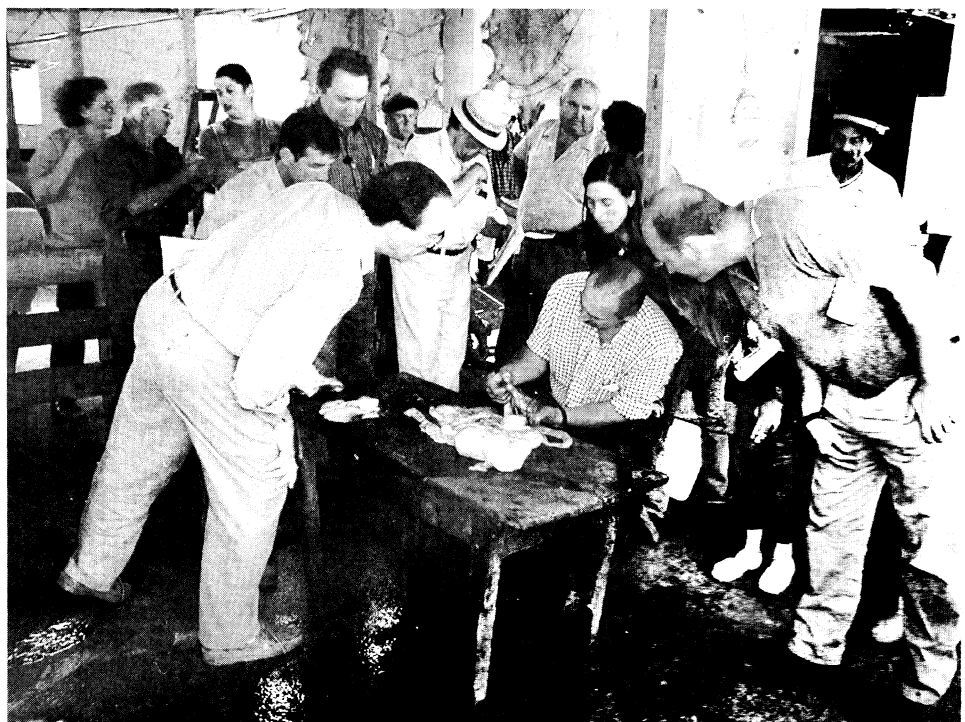
Actividades organizadas con el SUL sobre problemas sanitarios (Establecimiento familia Martigani. Paraje Santana).

Ensayos demostrativos: Como dispositivo metodológico buscan abordar, a nivel de implementación, el manejo de algunas técnicas o mostrar posibles soluciones a un problema dado a nivel predial. Este método genera mayor interacción con los productores, al apelar a temáticas sentidas y al "aprender haciendo", pero mantiene la limitante de tratarse de abordajes puntuales que no contemplan su inserción en el sistema de producción.