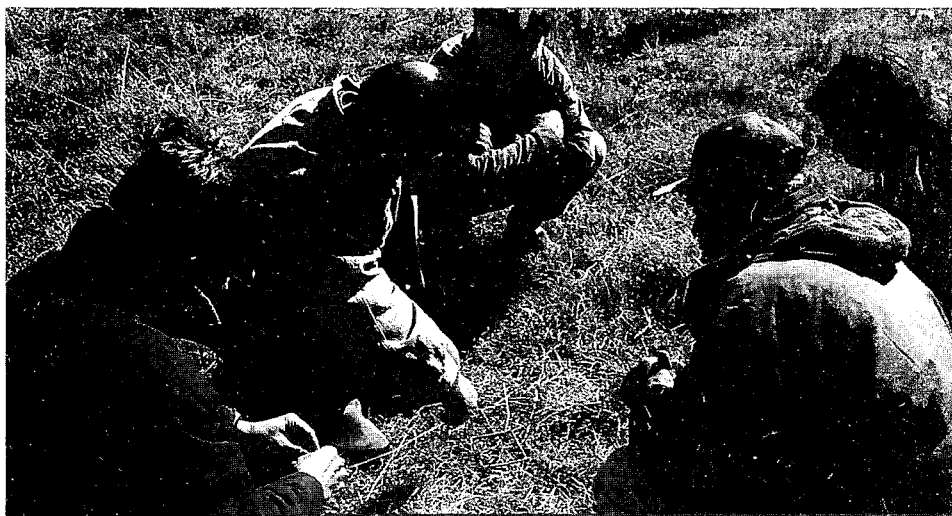
Ensayo de control de gramilla en campo natural (Establecimiento familia Cayrus, Colonia «Pintos Viana», 9/9/02).

las suscripciones 2004 tienen un costo de $ 180.- dentro del territorio nacional la nueva edición de Cangüé es semestral interesados dirigirse a: