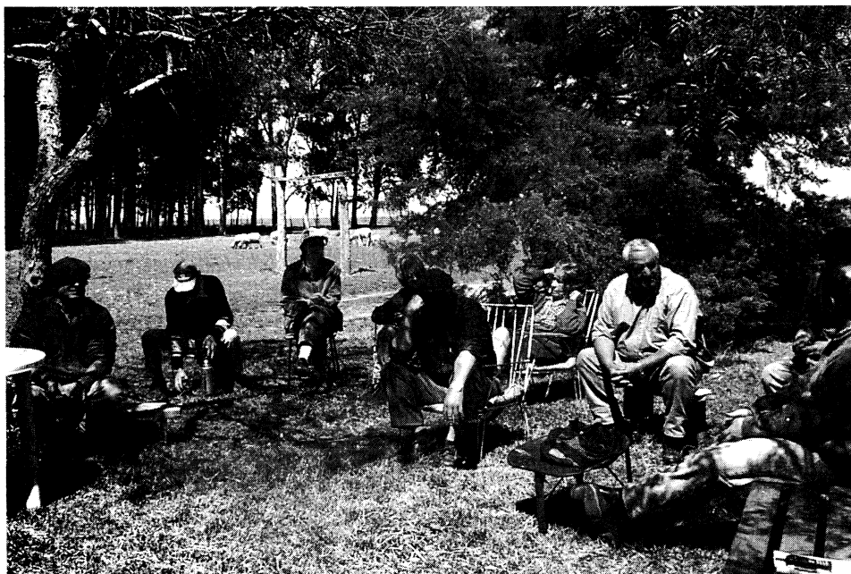
Talleres de pasturas (Establecimiento de la Familia Pereira, Colonia «Batlle y Ordoñez», 7/10/03).