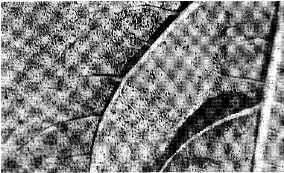
Figura 1: Pústulas de roya negra en el envés de la hoja de girasol.

Bajo condiciones climáticas frías, las pústulas urediales se tornan pústulas teliales de color marrón oscuro o negro. Estas pústulas contienen teliosporas bicelulares, que son las estructuras invernales del hongo, con paredes más gruesas y más resistentes. Una característica de estas esporas es que no son fácilmente separables de la hoja 7,9,10,19 .